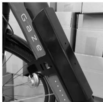
Model Y for Grenoble