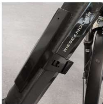
Model Y for Nevo