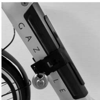
Model Y for Ultimate

De Model Y is er in verschillende varianten. De montage is voor elk model hetzelfde.